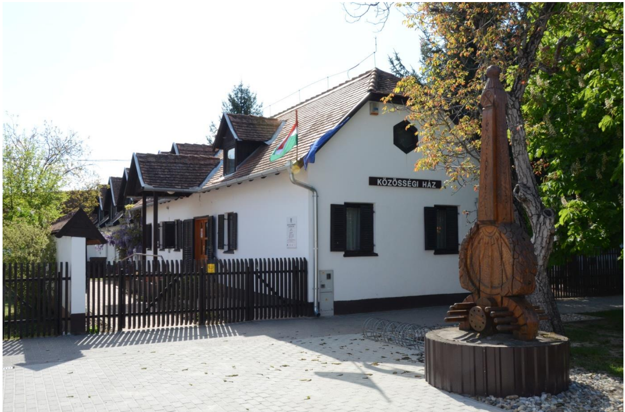
Gy. Szabó Béla Képtár és Könyvtár