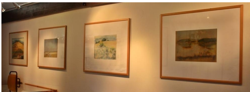
Kiállítás- részlet; szanki pasztellek