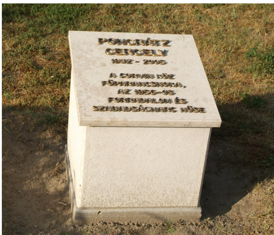
Pongrátz Gergely emléktábla