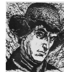
Tibeti sapkás önarckép

„Szank világ örökséget őrizhet egy nagy művész jóvoltából „(Fábián Gyula) A képtár újabb és újabb kiállításával, kulturális rendezvényeivel valódi értékeket közvetít.